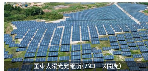
国東太陽光発電所(パローズ開発)