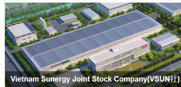
Vietnam Sunergy Joint Stock Company(VSUN社)