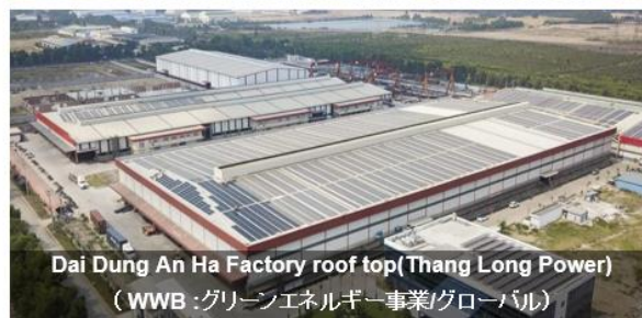
Dai Dung An Ha Factory roof top(Thang Long Power) (WWB:グリーンエネルギー事業グローバル)